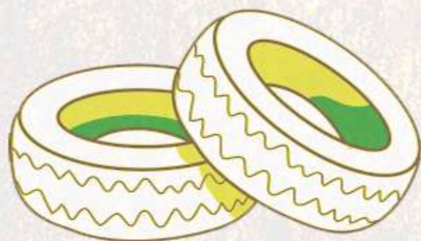
Lantas y otros inservibles