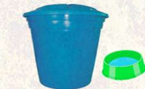
Albercas y tanques Platos de animales.